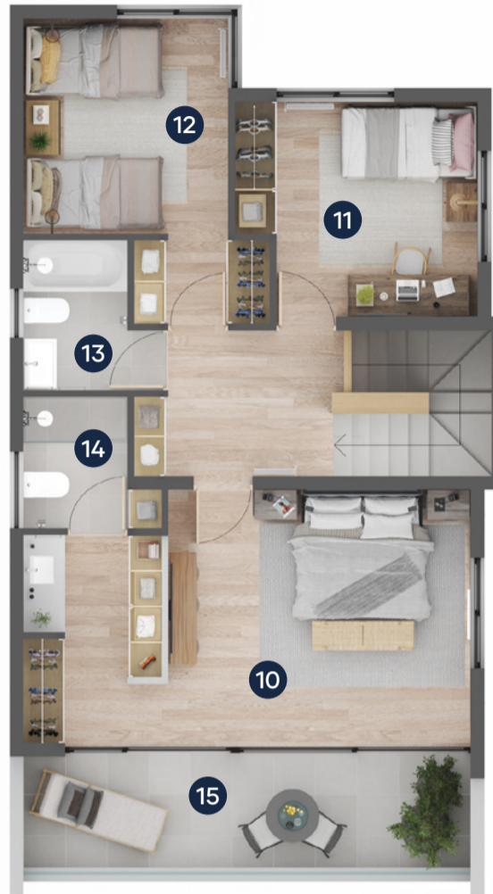
PLANTA SEGUNDO PISO

* Adosadas por muro de cocina (Segundo piso no se encuentra adosado) * PLANOS PRELIMINARES