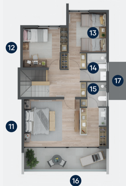
PLANTA SEGUNDO PISO

*Adosadas por muro de cocina (Segundo piso no se encuentra adosado)