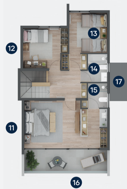
PLANTA SEGUNDO PISO

*Adosadas por muro de cocina (Segundo piso no se encuentra adosado)