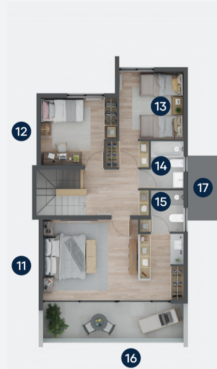
PLANTA SEGUNDO PISO

*Adosadas por muro de cocina (Segundo piso no se encuentra adosado)