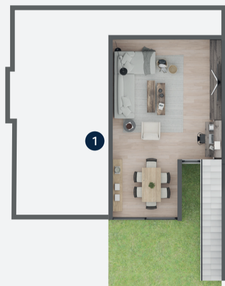
BODEGA SUBTERRÁNEO MULTIPROPÓSITO